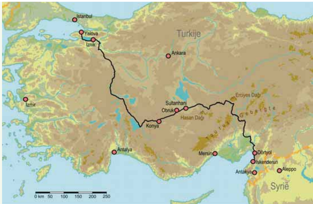
Kaart: Wobien Doyer, met medewerking van Han Lasance.

een eindeloze, woestijnachtige vlakte. Een monotonie die door slechts een heuvelrug en een paar dorpjes wordt onderbroken. We steken de vlakte over in het ritme van de karavanen, die hier ooit een handelsroute van en naar Perzië (Iran) volgden. We overnachten vlakbij Obruk en in Sultanhanı, met hun nog steeds indrukwekkende serail : grote, ommuurde overnachtingsplekken voor karavanen.