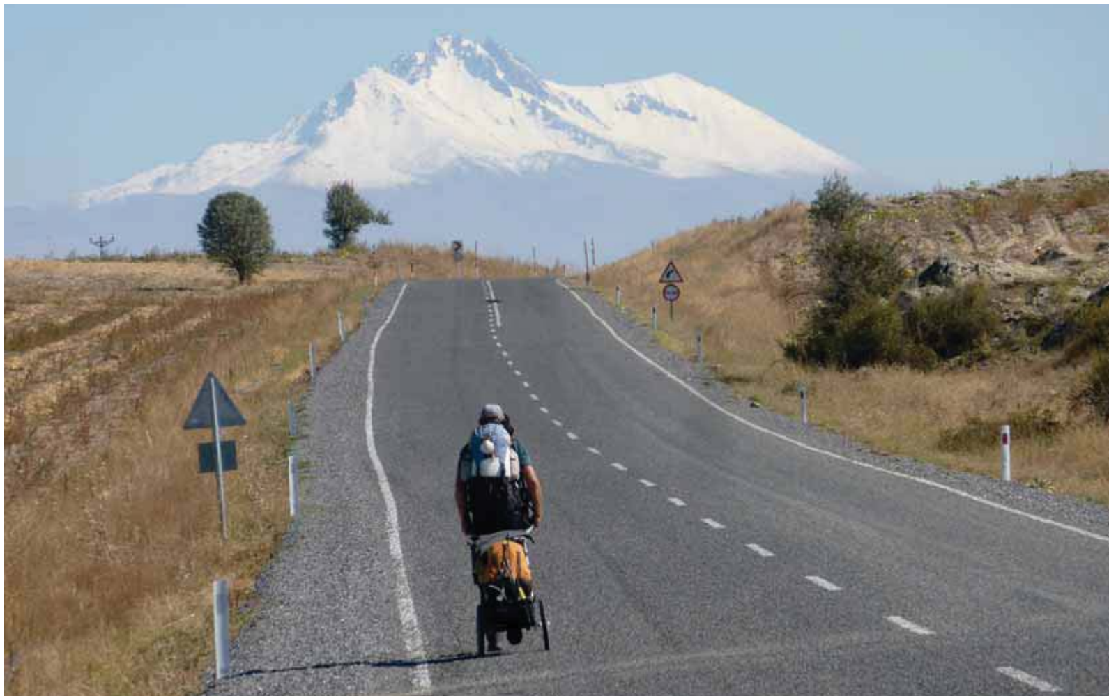
Vulkaan Erciyes Dağı als baken aan de horizon.